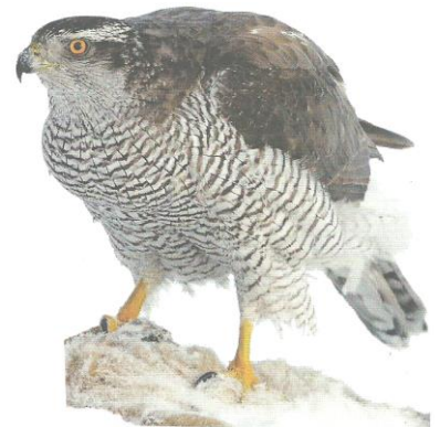
Vogel des Jahres 2015: Der Habicht

Wir bitten dringend darum, dass sich Mitglieder bei uns melden, die auch bei Arbeiten auf der Leiter oder bei der Anbringung von Nistkästen sowie Pflegemaßnahmen in der Natur gelegentlich helfen können. Es gibt immer wieder Arbeiten die man, schon der Sicherheit wegen, nicht allein machen kann.