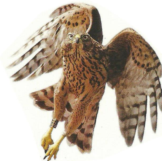
Dieser Junghabicht, ein schneller Luftjäger