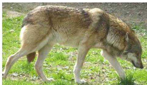
Wolf in einer Fasanerie

Dem Stadtwald Frankfurt (ab der Friedensallee nach Norden) geht es so schlecht wie nie seit den Kontrollen ab 1984. Das ist dem trockenen „Sommer“ von März bis Oktober geschuldet. 94,5% der Bäume hatten bei der Untersuchung im Hochsommer Schäden.