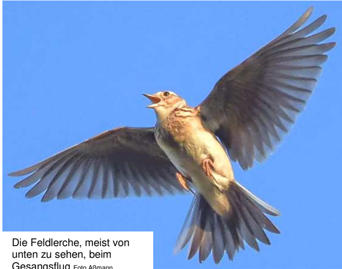
Die Feldlerche, meist von unten zu sehen, beim Gesangsflug

In der Arbeitsgruppe Umwelt haben wir ja schon immer für die Baumschutzsatzung plädiert. Das wäre die kosten- und arbeitssparende Lösung, ähnlich wie sie für Sprendlingen gilt, doch ist diese an der Mehrheit im Magistrat gescheitert. Der Schutz über das Baumkataster kostet viel und ist seit 14 (!) Jahren nicht überarbeitet. Das Kataster sollte 2018 erneuert werden, die Haushaltsmittel wurden aber wegen rechtlicher Fragen zurückgegeben. Solange gilt die Satzung ohne Einzelbaumerfassung.