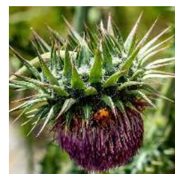
Marienkäfer auf Nickender Distel

bilden Körner und Früchte. Diese dienen den Vögeln bis in den Frühling hinein als Nahrung. Bei der Wahl der Pflanzen wurde darauf geachtet, dass das ganze Jahr vom Frühling bis in den Herbst etwas blüht. Natürlich mussten der Standort, Sonne wie Schatten oder die Wurzellage eines Baumes Berücksichtigung finden. Diese Vielfalt an Tieren ist außerdem nur ohne Einsatz von Gift und chemischem Dünger möglich.