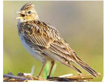
Vogel des Jahres 2019: Die Feldlerche