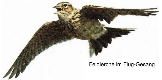
Feldlerche im Flug-Gesang

Der NABU-Bundesverband hat die Feldlerche zum Vogel des Jahres 2019 gekürt, nach dem Star, ein noch aus Liedern allbekannter Vogel, dessen Bestand aber, bedroht durch die heutige Landwirtschaft, radikal abgenommen hat.