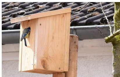
Kohlmeise in der Naturoase

Das erste Kohlmeisenpaar zog seine Jungen auf, andere Vögel gingen auf Nahrungssuche, Hausrotschwanz, Rotkehlchen, Blaumeise, Buchfink, Stieglitz usw. Selbst ein Baumläufer kletterte mit seinem Pinzettenschnabel den Stamm der Kiefer entlang, um in den Ritzen nach kleinen Insekten zu suchen.