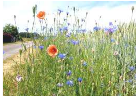
Ein Ackerrand, wie er der Feldlerche gefallen könnte

Sein Name stand jahrzehntelang für den Naturschutz in unserer Stadt; er war für uns hier, mit Wirkung über den Kreis Offenbach hinaus, ein unglaublich engagierter und streitbarer Wegbegleiter, der einen Großteil seines Lebens dem Naturschutz gewidmet und viel für unsere bedrohten Arten erreicht hat. Wir sind traurig und tief betroffen.