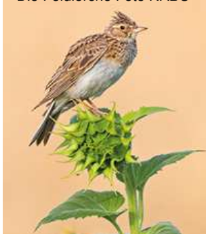
Die Feldlerche

NACHHALTIGKEIT ist, was unseren Enkeln eine intakte, vielgestaltige Natur hinterlässt. Keine Stein-Kies-Wüsten in Gärten, kein Gift sondern Artenvielfalt!